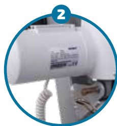
Motor eléctrico para la elevación