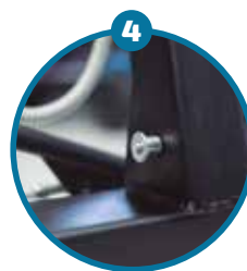
Quick Release para un fácil plegado Disponible para Grúa Aúpa Mini