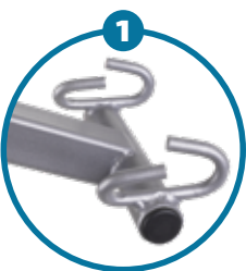
Percha con 4 puntos de seguridad