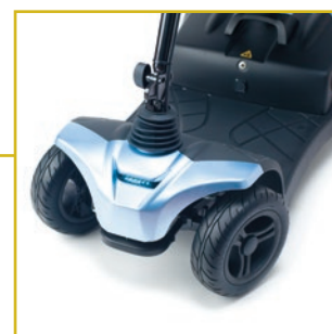
Luz led delantera