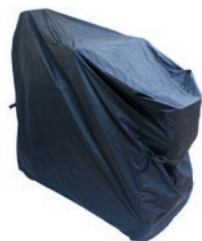
Funda de almacenaje